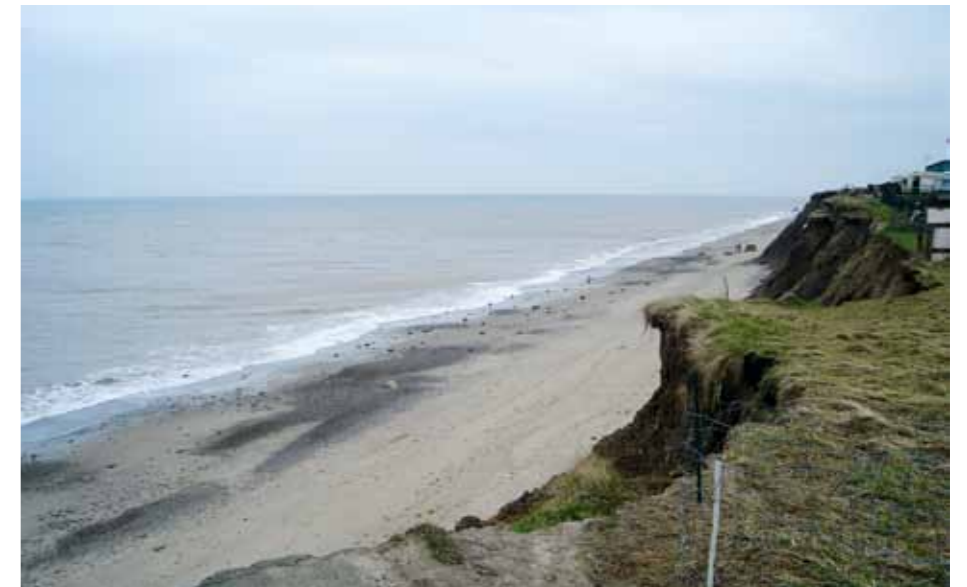
Het strand bij Bridlington waar ook dit jaar weer de nodige Belgische en Nederlandse vissers zullen deelnemen aan de 'European Open'.

Mijn voorspelling vorige maand was dan ook juist: geen reuzen van gullen, maar meer in de aantallen. Dat zien we ook aan de overkant van de plas aan de Engelse kust. Ook wij keken uit naar Bridlington, zoals we lazen in de aankondiging in dit blad, van de European Open op 25, 26 en 27 februari. Deze wedstrijd deed ons speuren naar wedstrijdplaatsen in de omgeving van het parcours Bridlington bij Spurt Point. Vanuit deze Vlaamse Hoek zijn we op donderdag 24 februari met vijf man vertrokken voor een ruime vijftien uur durende overtocht van Zeebrugge naar Hull, om aan deze mega-wedstrijd deel te nemen, die met ruim 60 km parcours zo lang is als de complete Belgische kust. De vangsten daar lopen quasi gelijk aan die van ons, zij het dat de gul daar wat vroeger (kort voor het kuit afleggen) onder de kust komt. Daar zijn in februari gullen tot 4 kg vanaf het strand te vangen. Met de vergelijking bij ons denk ik wel te kunnen rekenen dat maart nog wel eens voor verrassingen kan zorgen op onze stranden. Zeker als de garnaal -mits het niet bij al te veel nachtvorst blijft- weer onder de kust zal verschijnen. Moet dit niet het geval