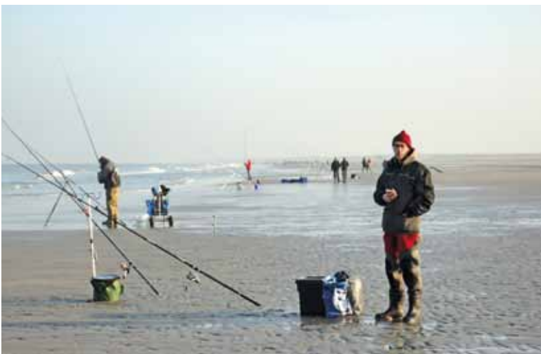
Decor van de laatste wedstrijd uit de Penn Korpsen Competitie 2011 aan het strand van 's-Gravenzande.

met de overige, veelal gesponsorde zeevisteams. In stilte hoopt het team daarom ook dat de Penn Korps Competitie voortaan beschouwd zal worden als selectiemethode voor teams die naar het WK mogen. De teamleden vinden het allen fantastisch dat een aantal vissers zelf het